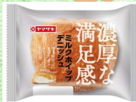
ミルクホイッ プデニッシュ