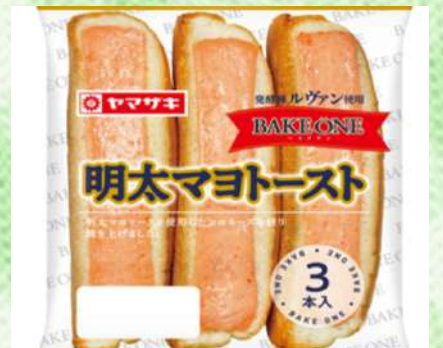
明太マヨトー スト(3)