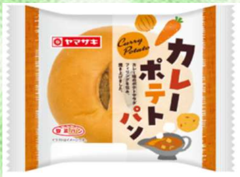
カレー ポテトパン