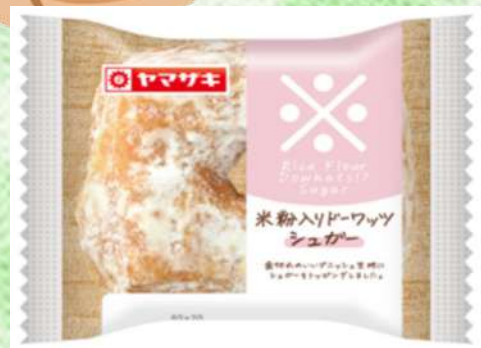
米粉入りドーワ ツツ(シュガー)